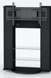
■ 1120 BL