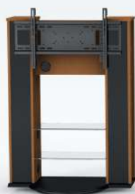
■ 1120 WG